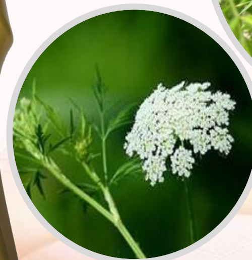
ПЛОДЫ ЖГУН-КОРНЯ МОННЬЕ