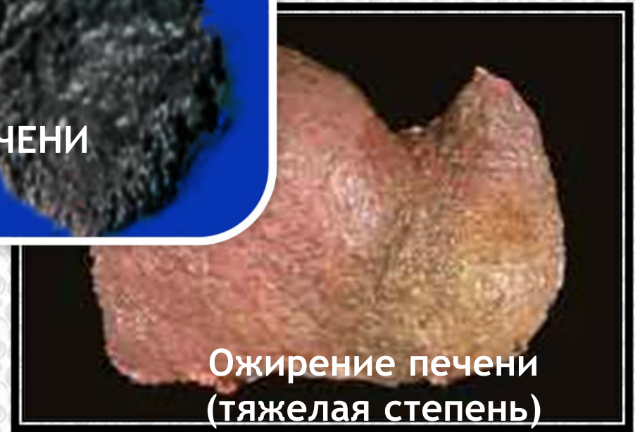
Ожирение печени (тяжелая степень)