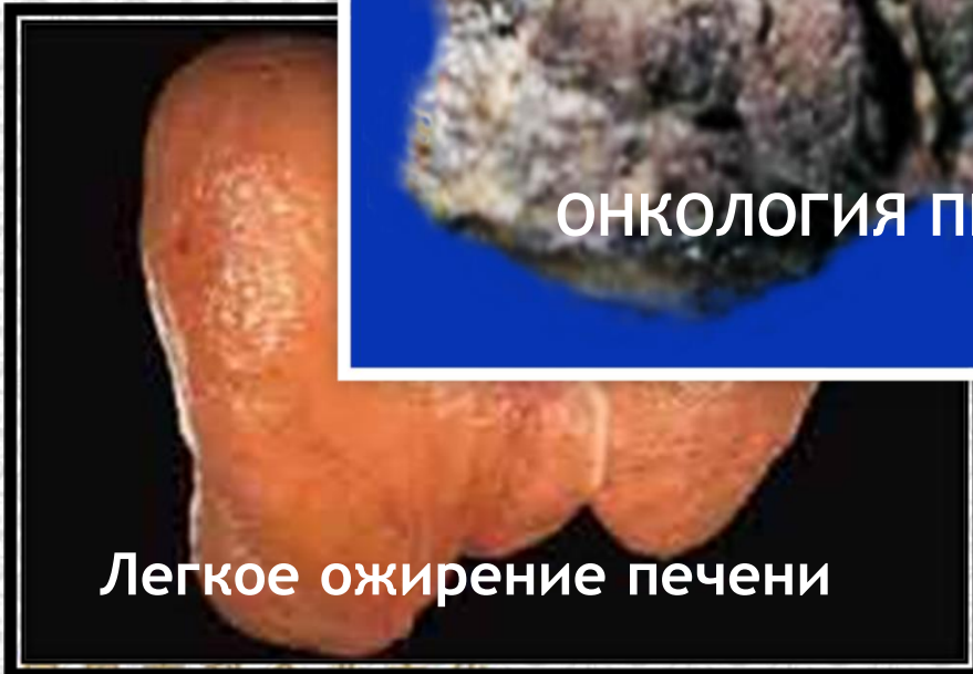
Легкое ожирение печени